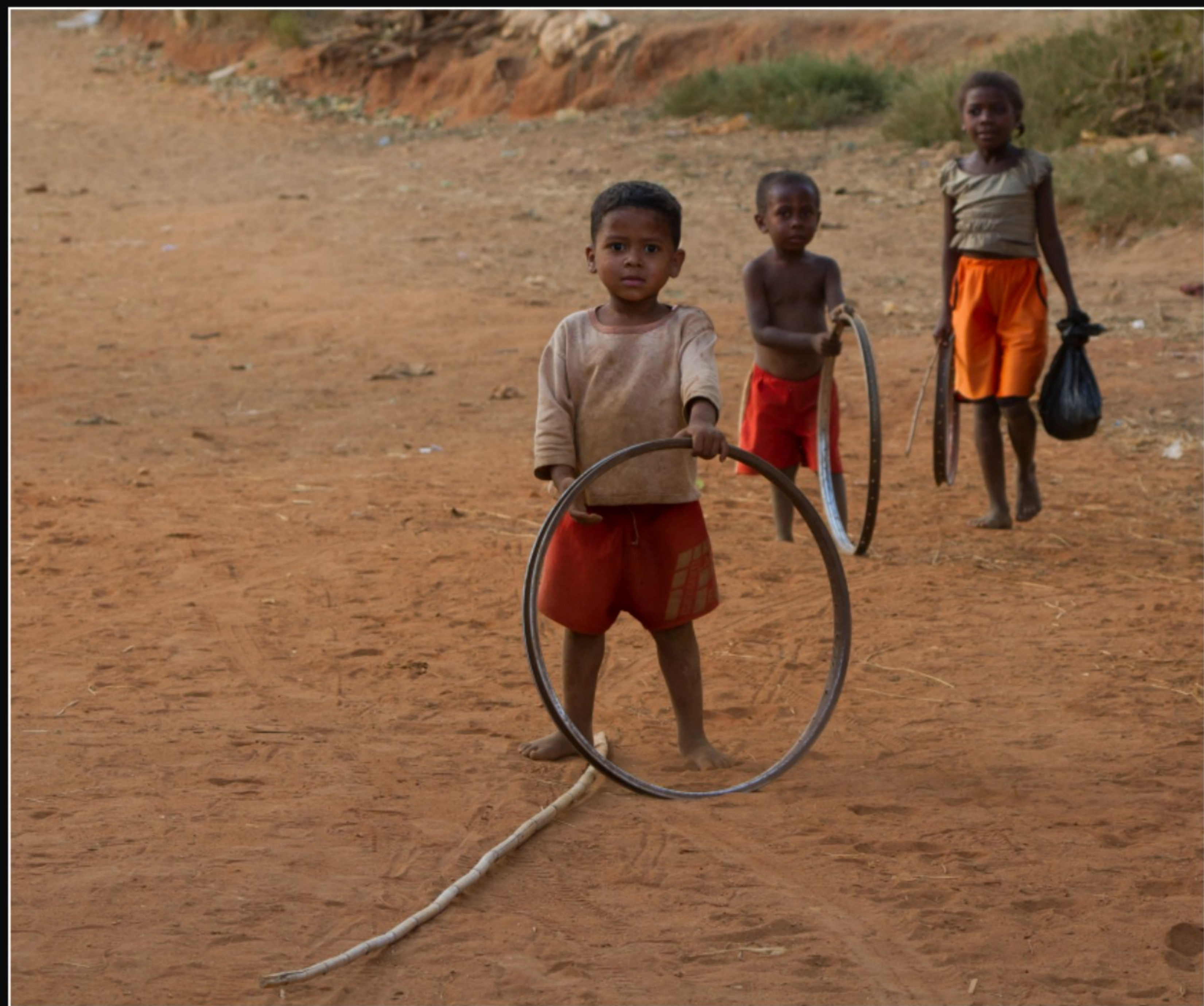
SPIELLENDE KINDER IN MANJA ...