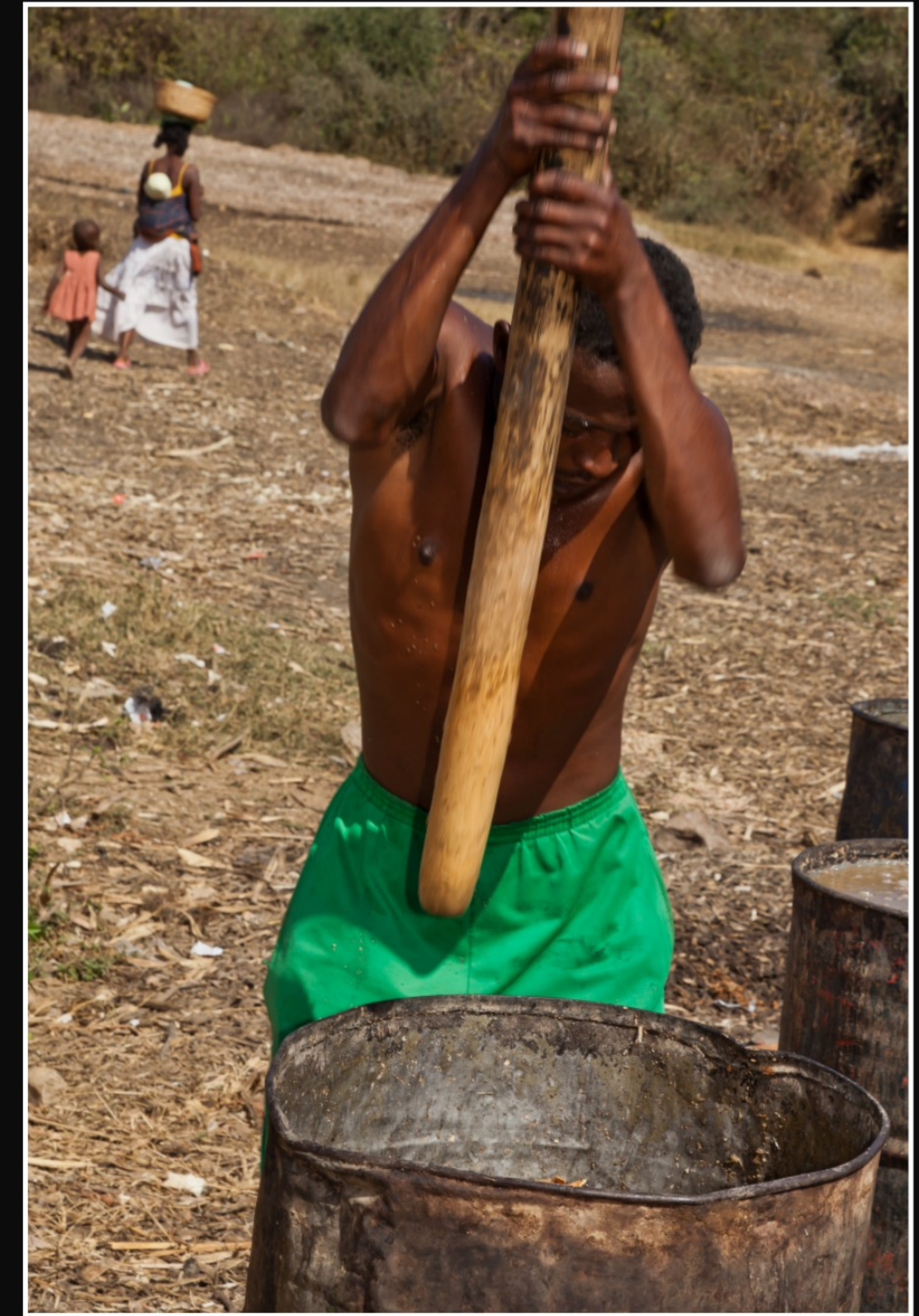
... MIT EINFACHSTEN HILFSMITTELN UND MANNESKRAFT.