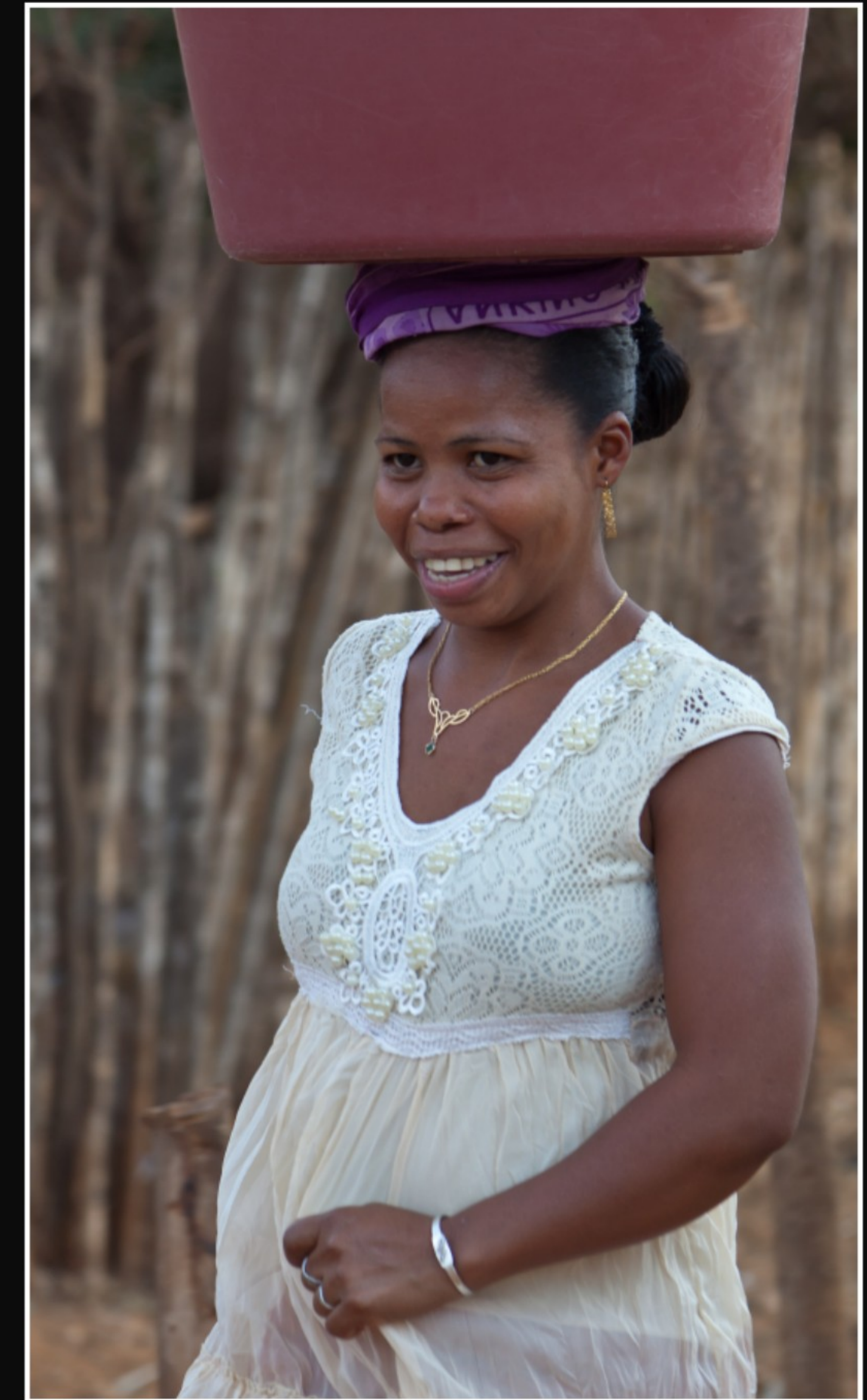
MADAGASSEN BEI DER ARBEIT ... MEISTENS MIT EINEM LACHEN AUF DEM GESICHT