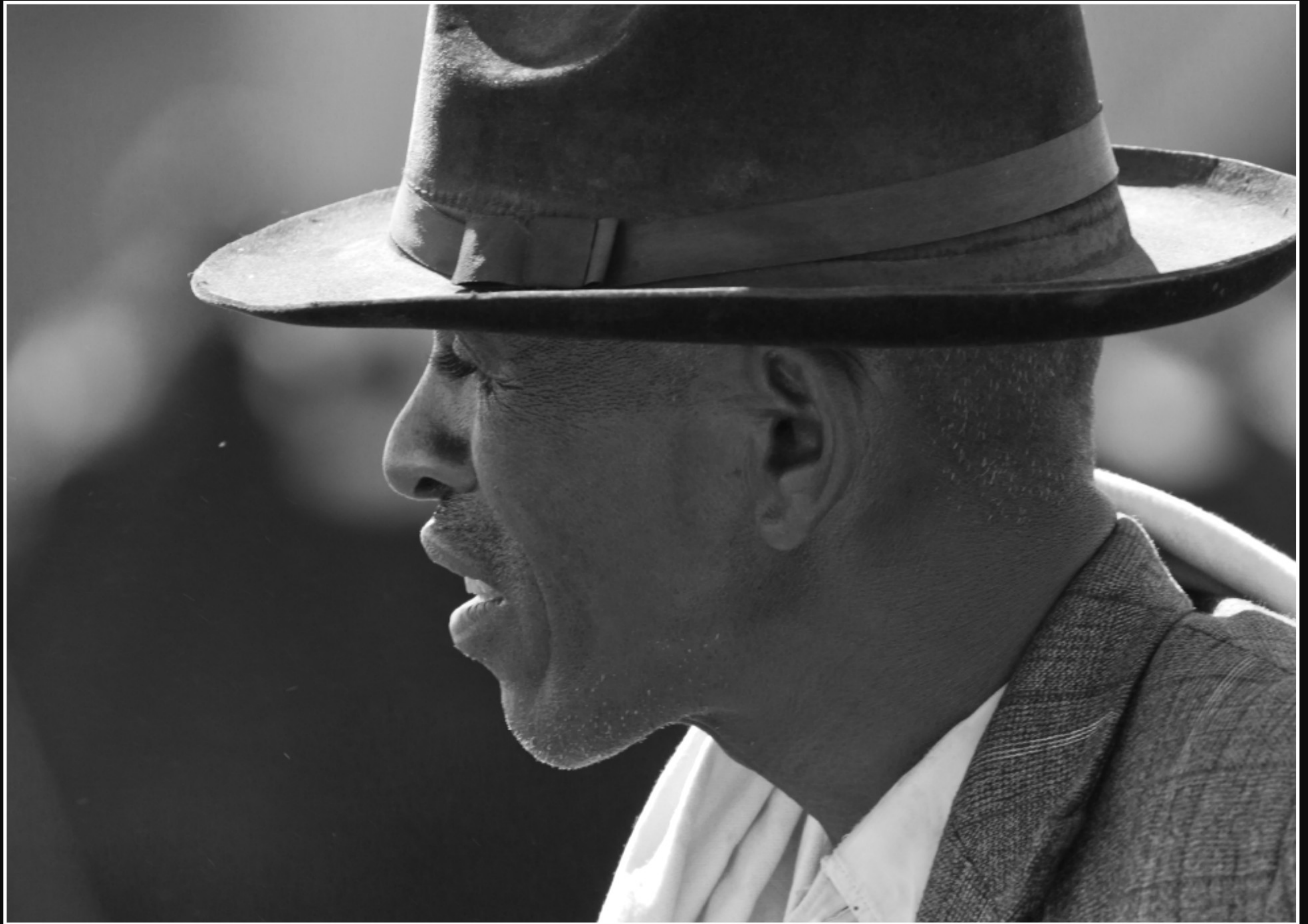
GESCHÄFTSMANN AM VIEHMARKT ...