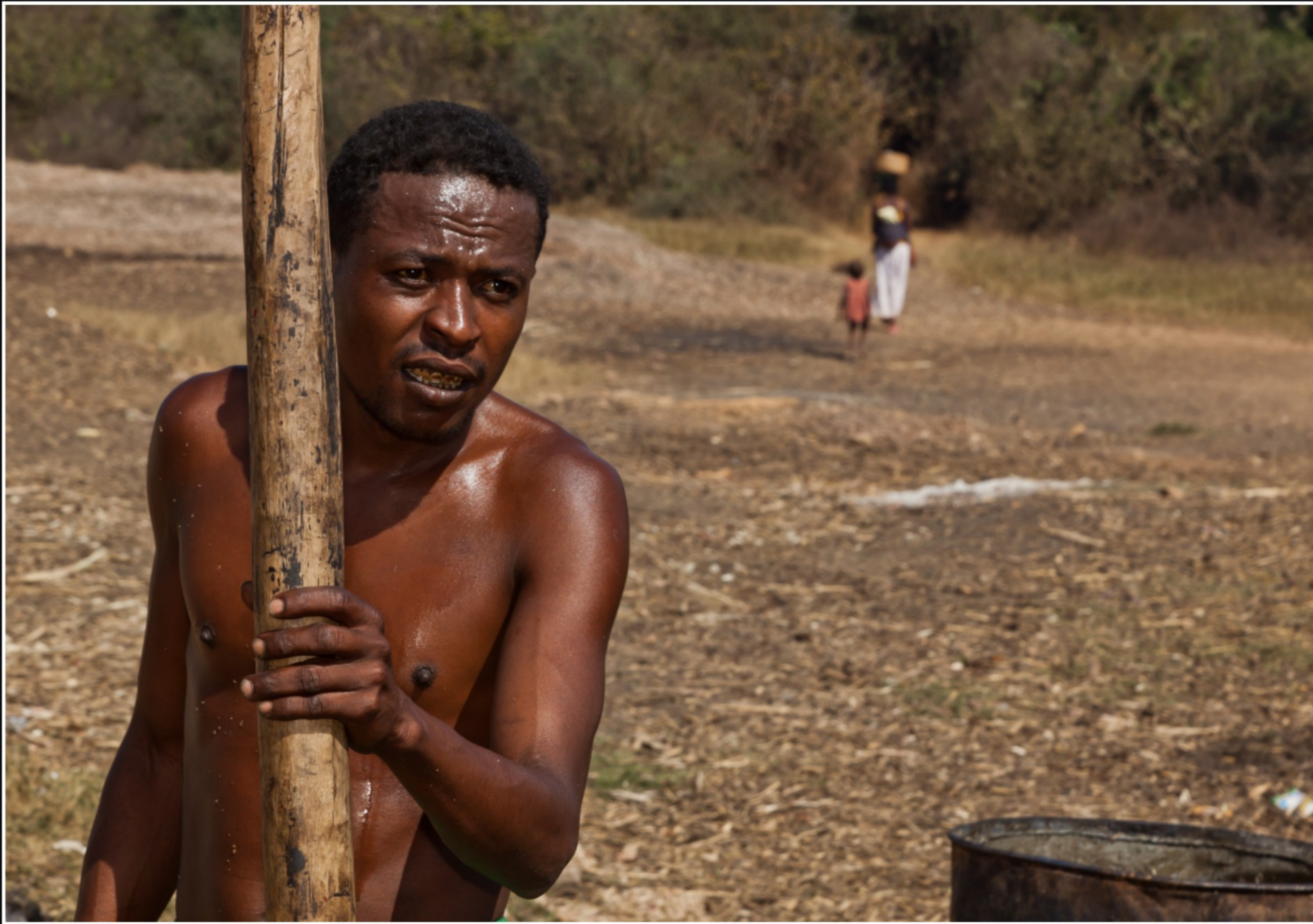
HIER WIRD ILLEGALER, HOCHPROZENTIGER RUM HERGESTELLT ...