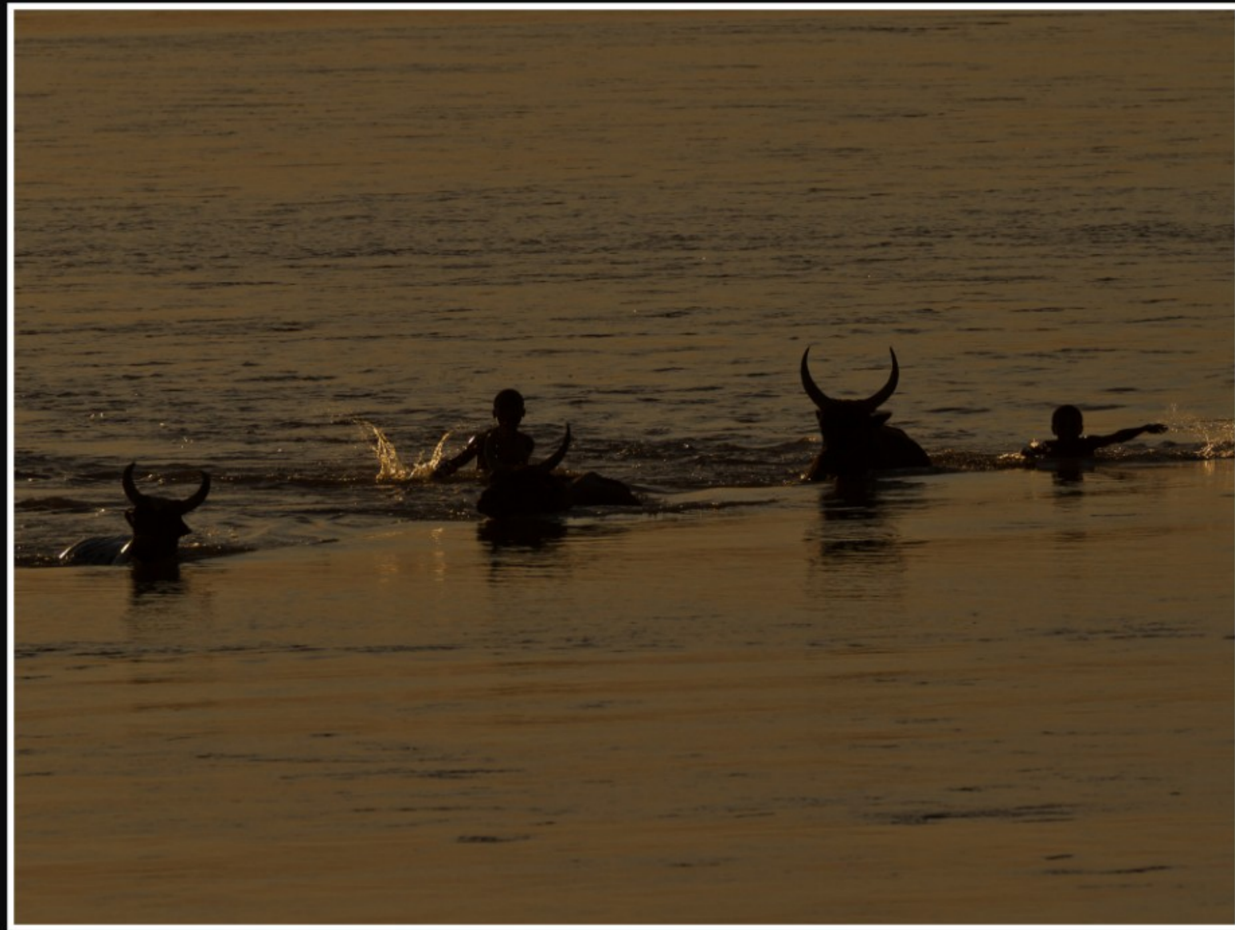
AUSGELASSENHEIT UND FREUDE AM FLUSS ...