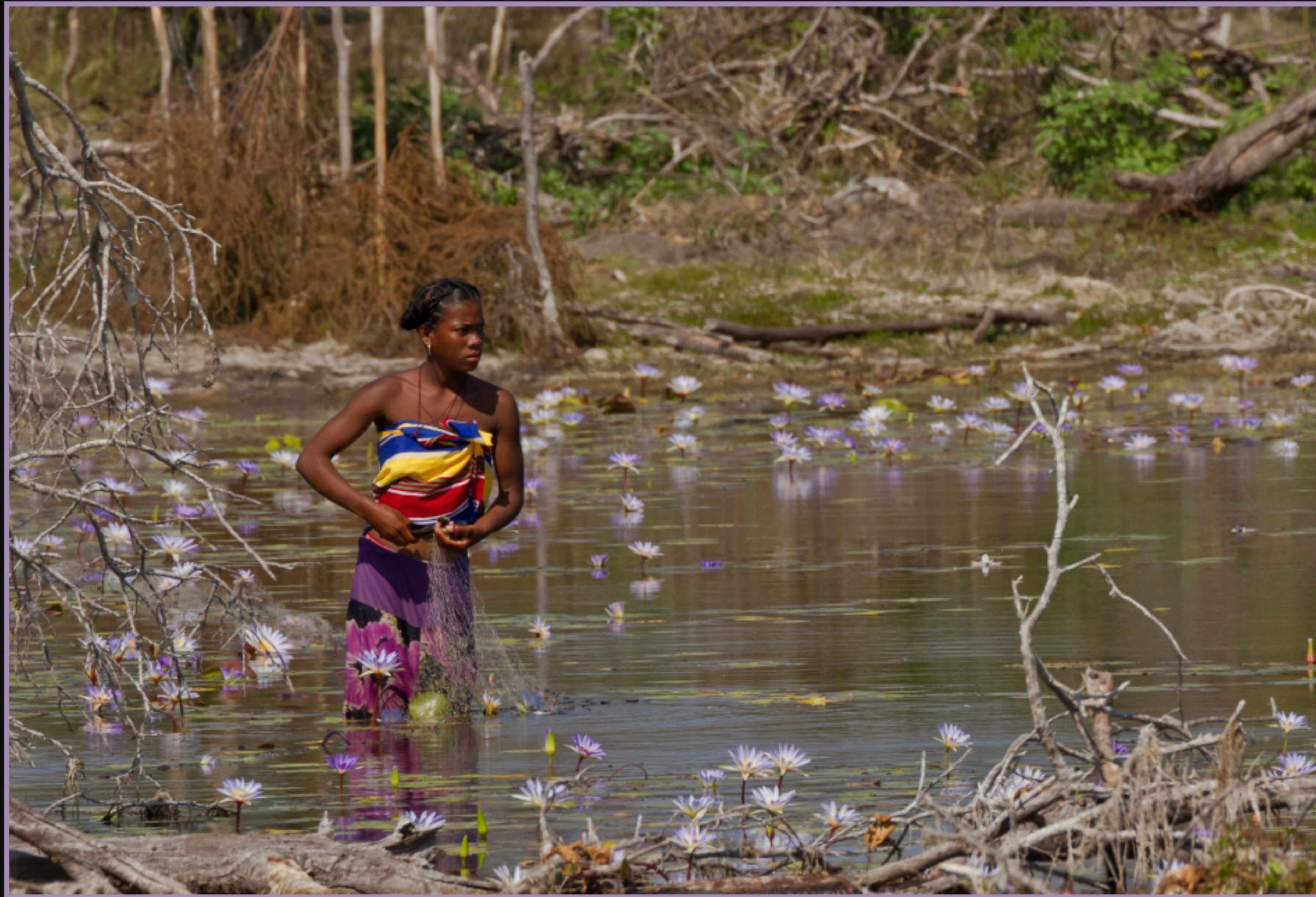
FISCHERIN INMITTEN EINER HERRLICHEN BLUMENPRACHT ...