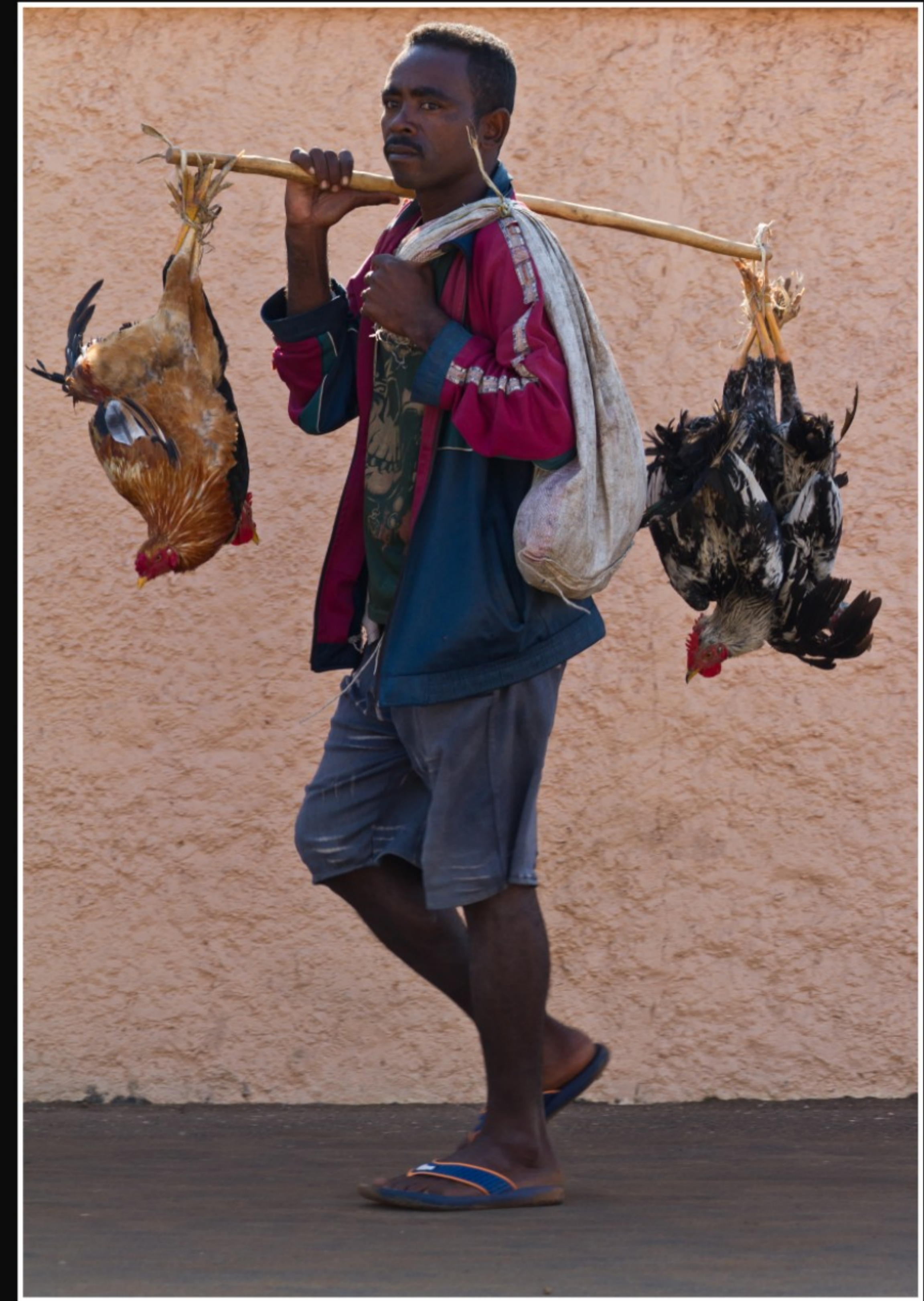
... DANN GEHT DIE REISE MIT DEM "MITTAGESSEN" WEITER.