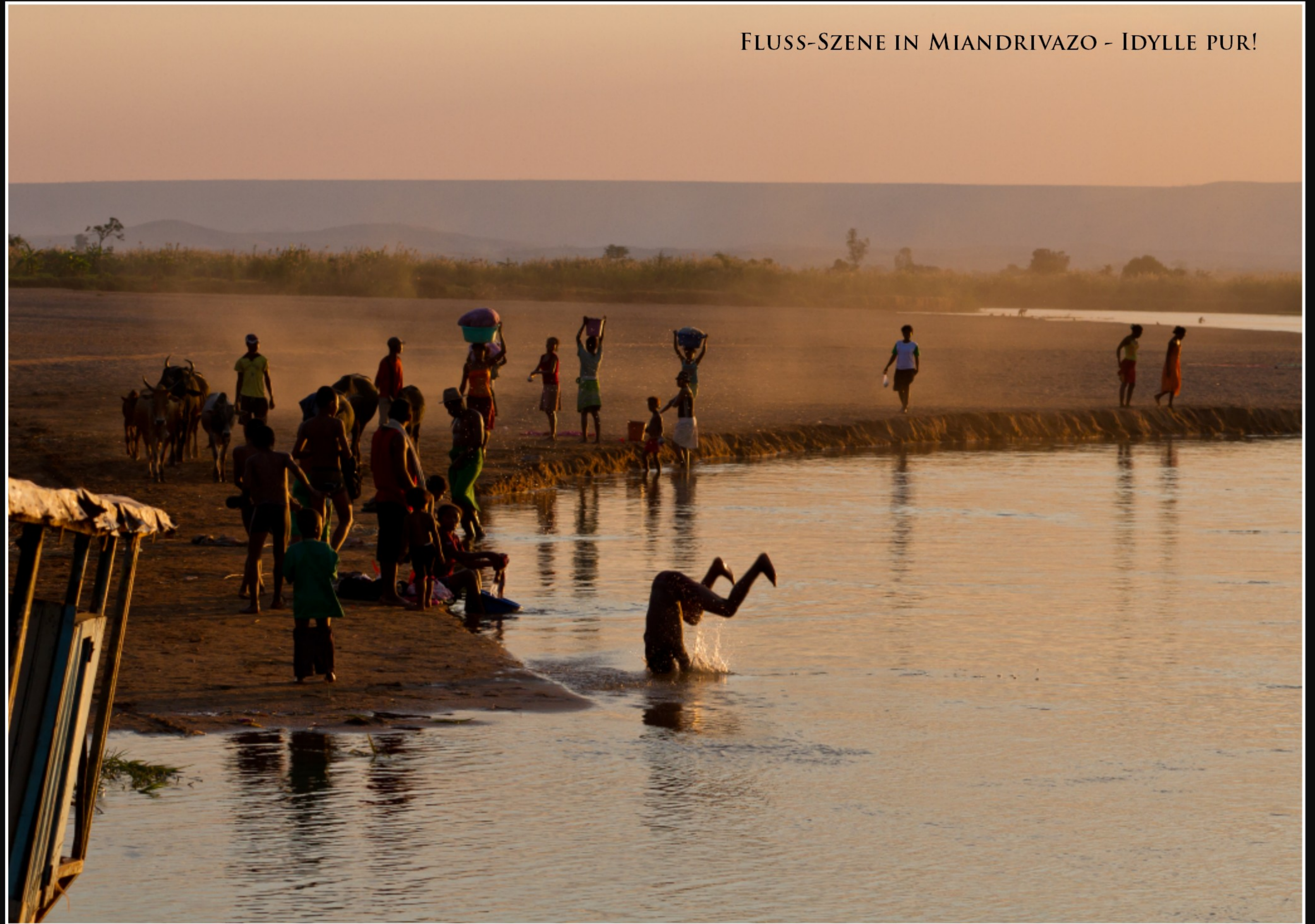
FLUSS-SZENE IN MIANDRIVAZO - IDYLLE PUR!