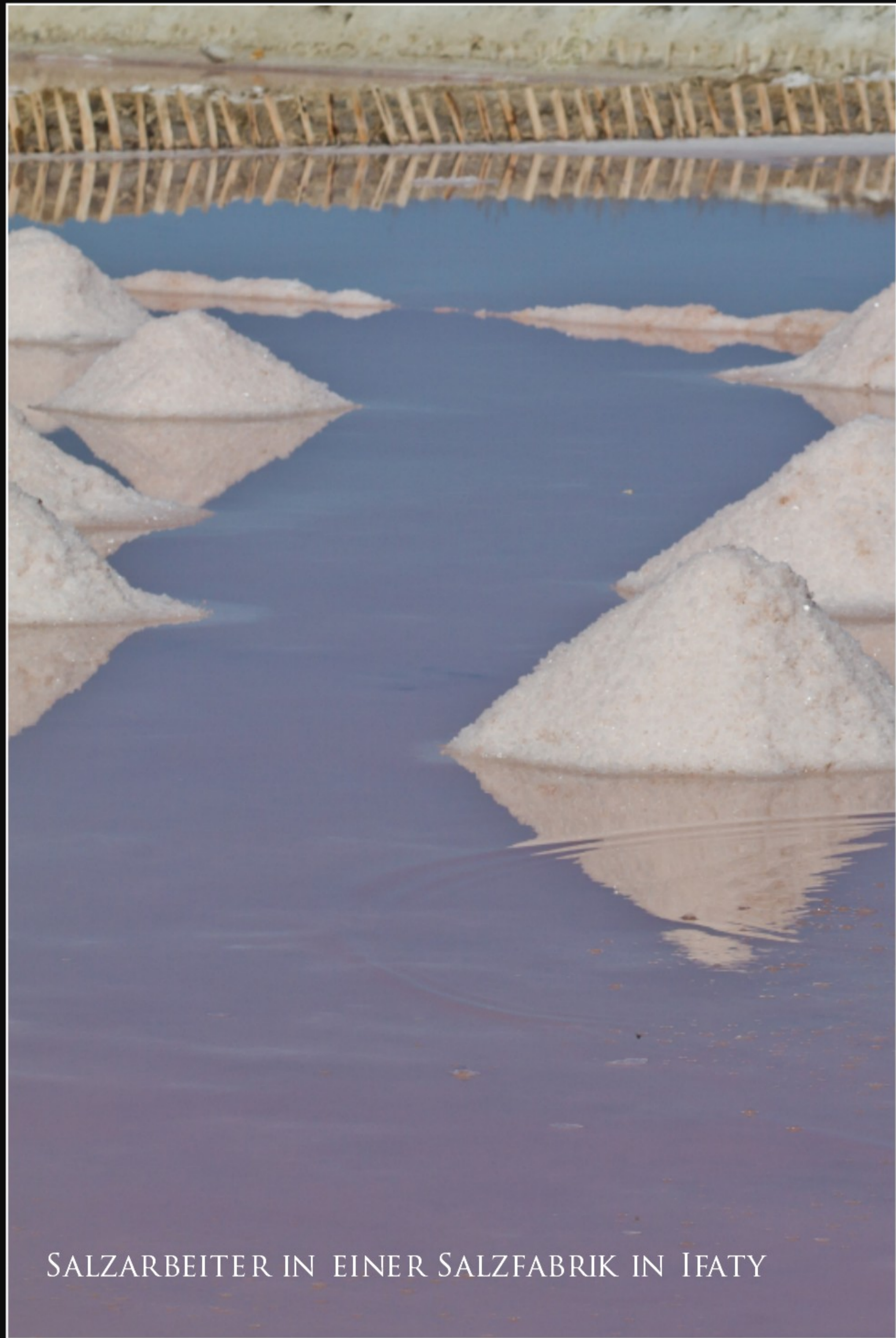
SALZARBEITER IN EINER SALZFABRIK IN IFATY