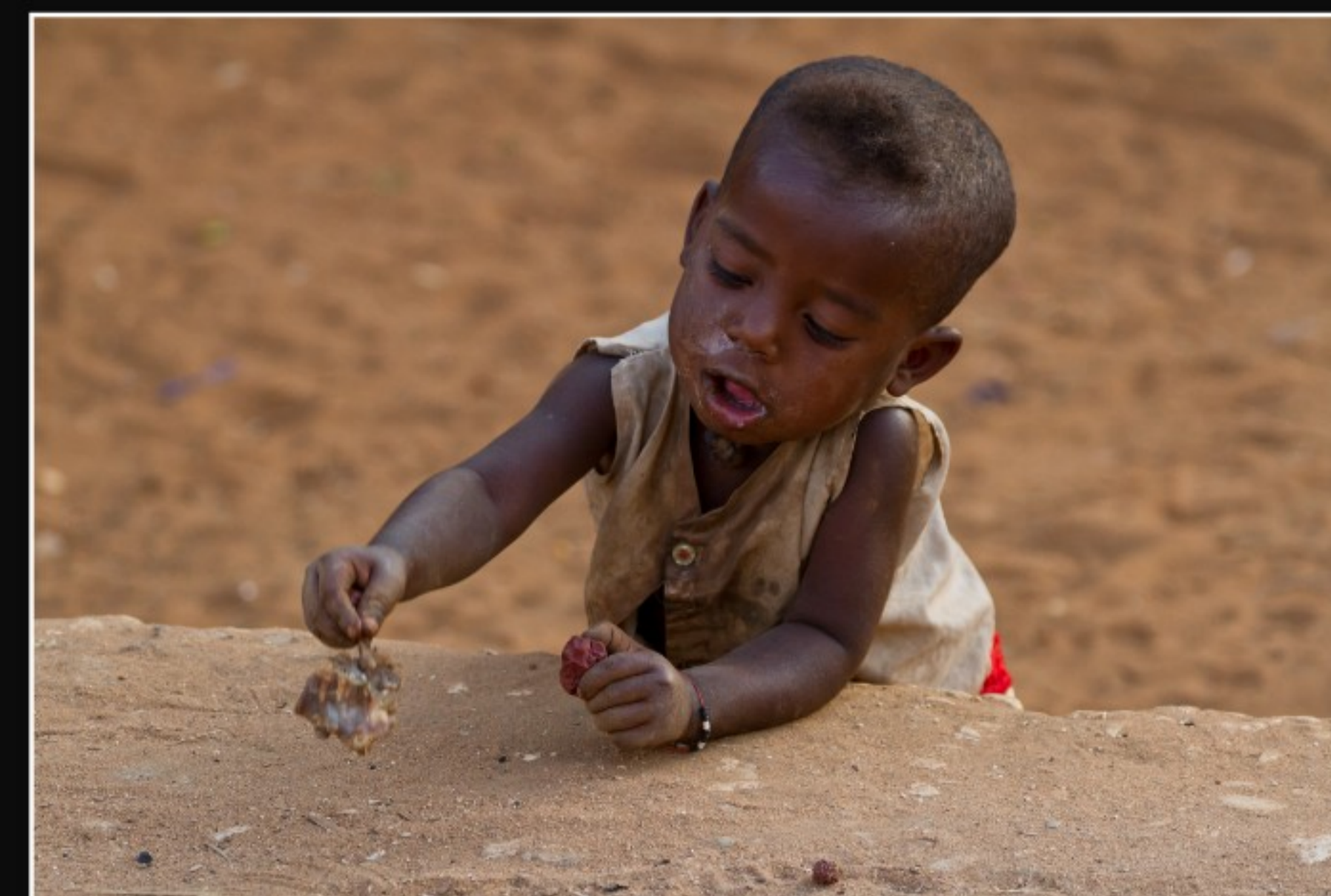
GEGESSEN WIRD, WAS RUMLIEGT ...