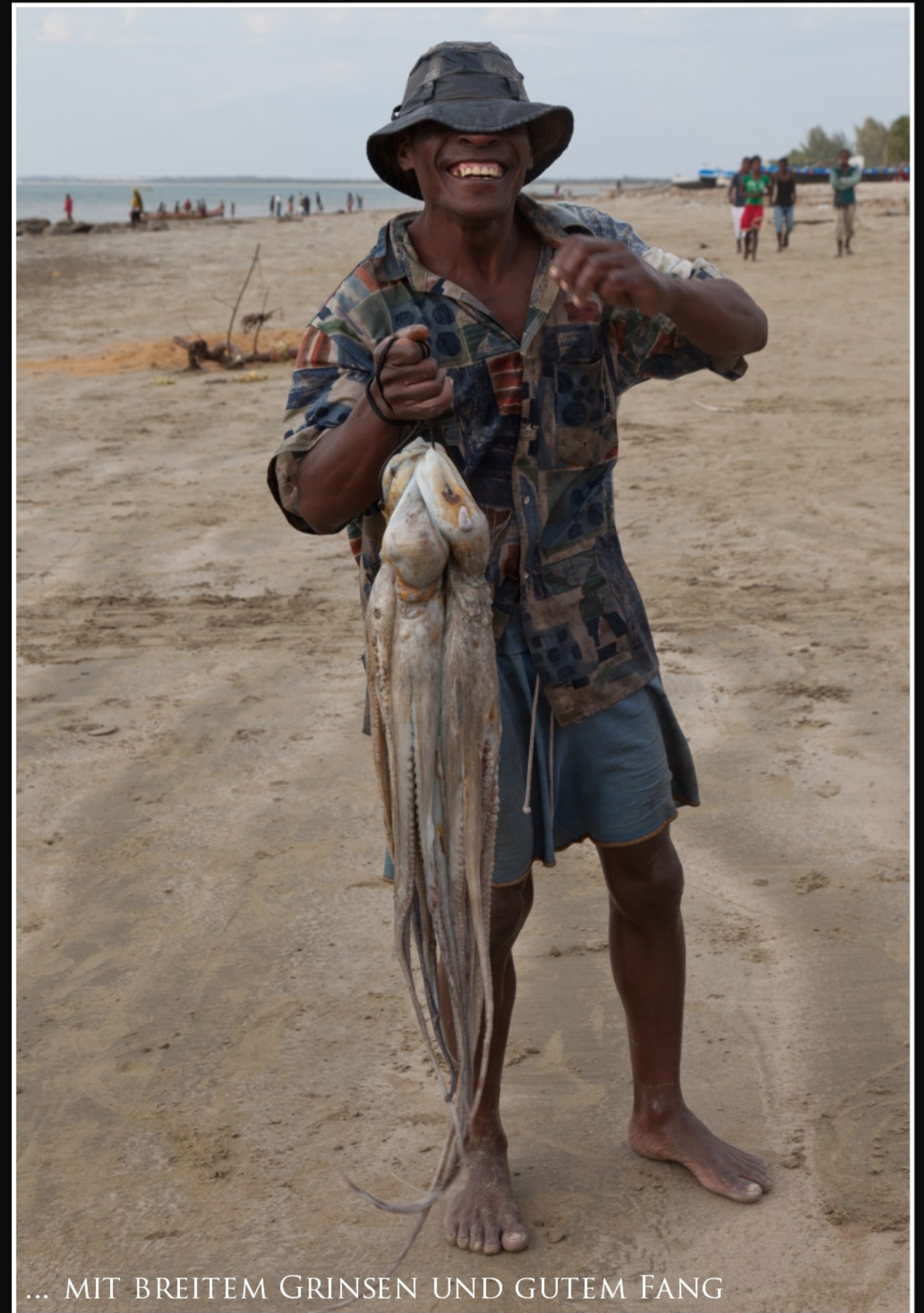
... MIT BREITEM GRINSEN UND GUTEM FANG